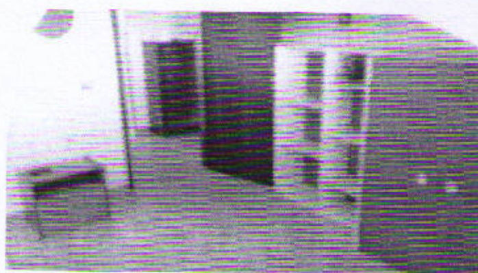
Via Piazza Cavour, piano primo bagno