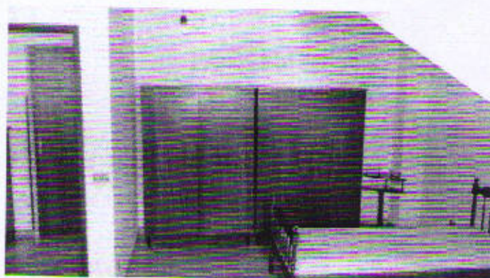
Piazza Cavour, piano primo