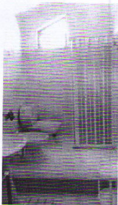
Via Piazza Cavour, piano primo bagno