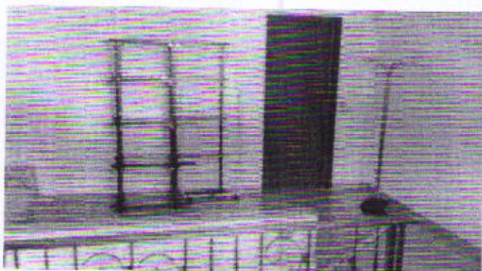
Piazza Cavour, piano primo