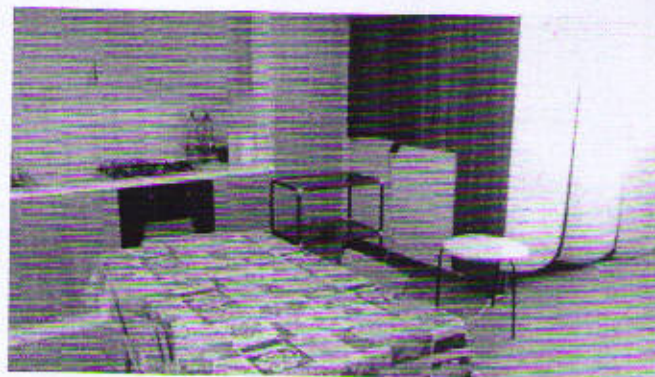
Piazza Cavour, piano primo