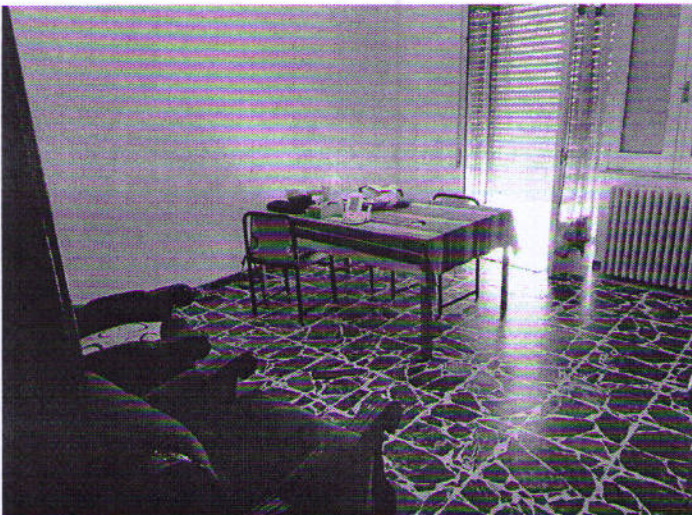
Via Nazionale n. 2, salotto