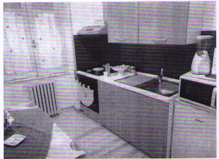
Via Nazionale n. 2, Cucina