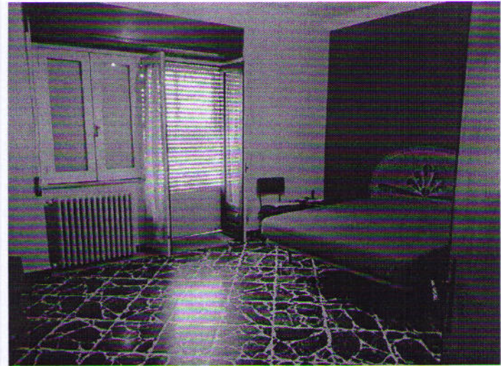
Via Nazionale n. 2, camera letto