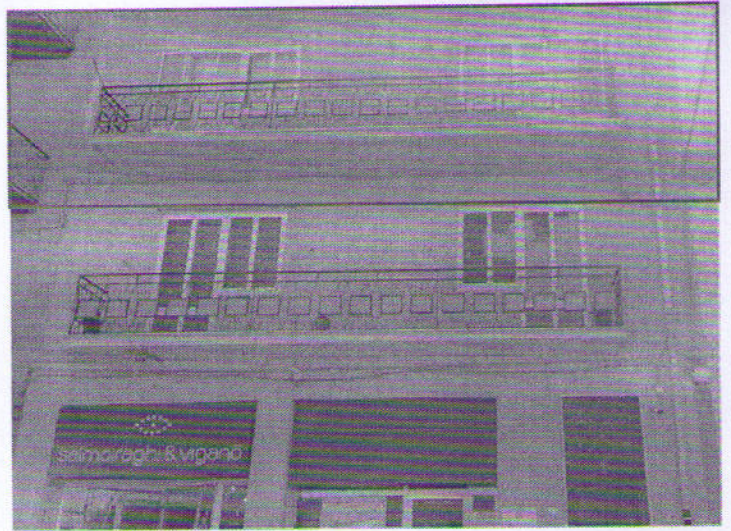
Via Nazionale n. 2, piano secondo