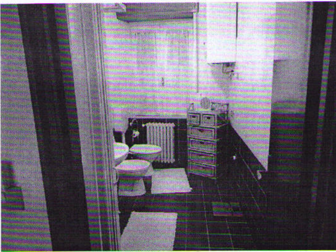
Via Nazionale n. 2, bagno